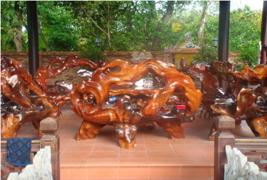
Một sản phẩm gỗ độc đáo được thiết kế bởi người địa phương đang trưng bày trong nhà vườn Huế.